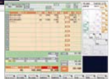
※ POSCM NEO 操作画面イメージ ※ 画面イメージは予告なく変更する場合があります